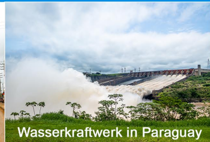
Wasserkraftwerk in Paraguay