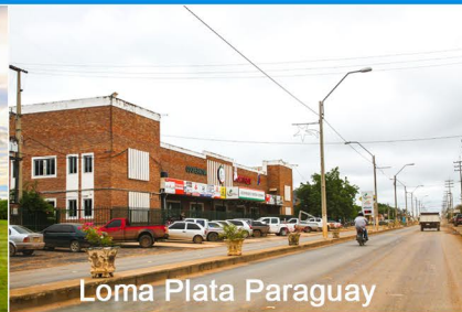
Loma Plata Paraguay